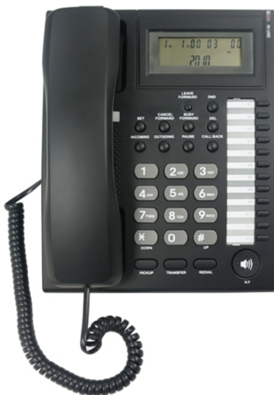
PH-206 Analóg Telefonkészülék